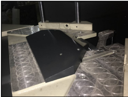
2 posições de fresas